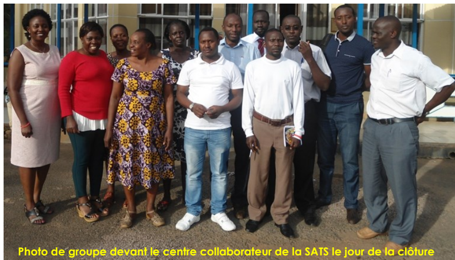
Photo de groupe devant le centre collaborateur de la SATS le jour de la clôture