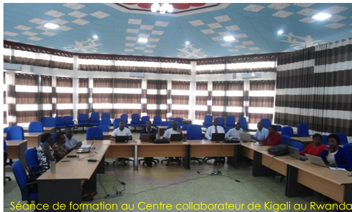
Séance de formation au Centre collaborateur de Kigali au Rwanda