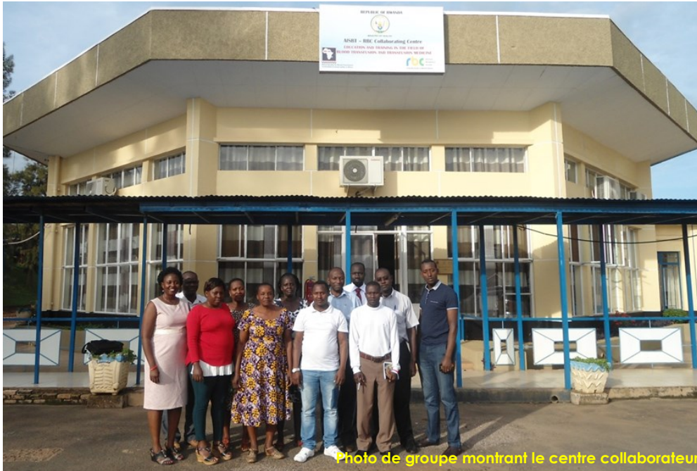
Photo de groupe montrant le centre collaborateur