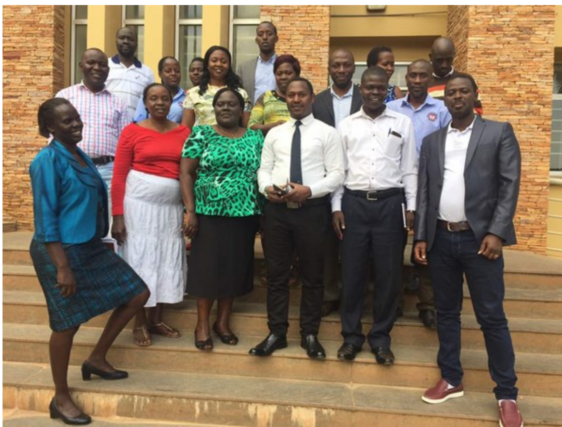
Educateurs de la SATS avec le personnel de l'UBTS après l'évaluation

Toutes les fonctions essentielles de l'UBTS ont été évaluées au cours de cette mission par rapport aux normes de la SATS et ont concerné les sections suivantes: mobilisation, sélection et recrutement des donneurs de sang; collecte et séparation du sang en produits sanguins, groupage sanguin et le dépistage des maladies transmissibles par transfusion; manutention, transport et stockage, ainsi que la distribution de sang et des produits sanguins aux banques de sang des hôpitaux