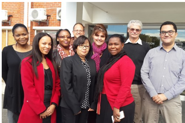
Formation du groupe des Evaluateurs – Cape Town, Afrique du Sud